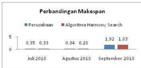
Gambar 3. Analisis grafik perbandingan ( makespan )

Analisis histogram menggambarkan hasil perbandingan makespan dari metode perusahaan dan algoritma harmony search. Hasil histogram menunjukkan bahwa nilai makespan dari metode algoritma harmony search lebih optimal 0,06 selama tiga bulan. Hasil dari metode algoritma harmony search meyakinkan bahwa nilai keoptimalan sangat berperan penting dalam meminimalisir nilai makespan . Berikut adalah hasil visualisasi diagram histogramnya.