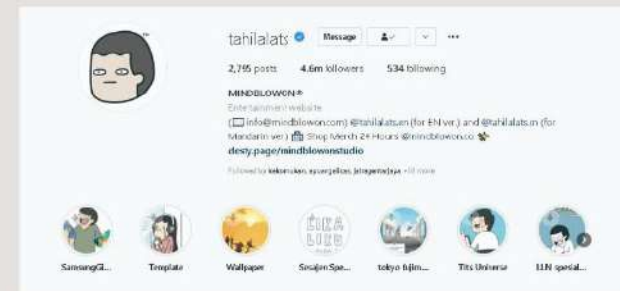
Gambar 2. akun Instagram tahilalats

FGD dilakukan sebanyak empat kali dengan rentang waktu satu bulan penuh. Jeda pelaksanaan FGD selama satu minggu agar Informan dapat melakukan seleksi pesan pemasaran. FGD memiliki topik pembahasan antara lain : pemahaman gambar, pemahaman caption, pemahaman maksud pesan