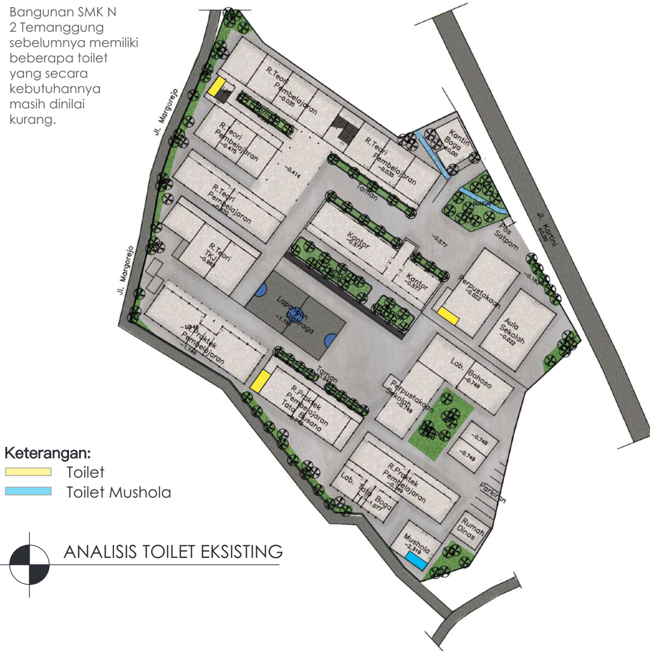
FOTO EKSTING TOILET

Bangunan SMK N 2 Temanggung sebelumnya memiliki beberapa toilet yang secara kebutuhannya masih dinilai kurang.