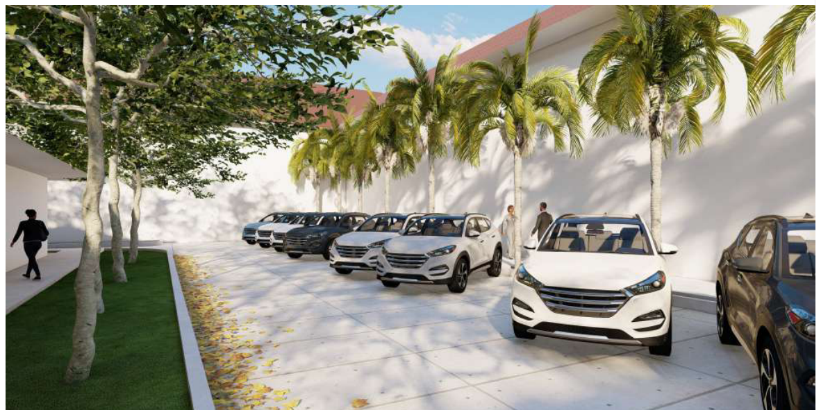
GAMBARAN BANGUNAN 2 LANTAI