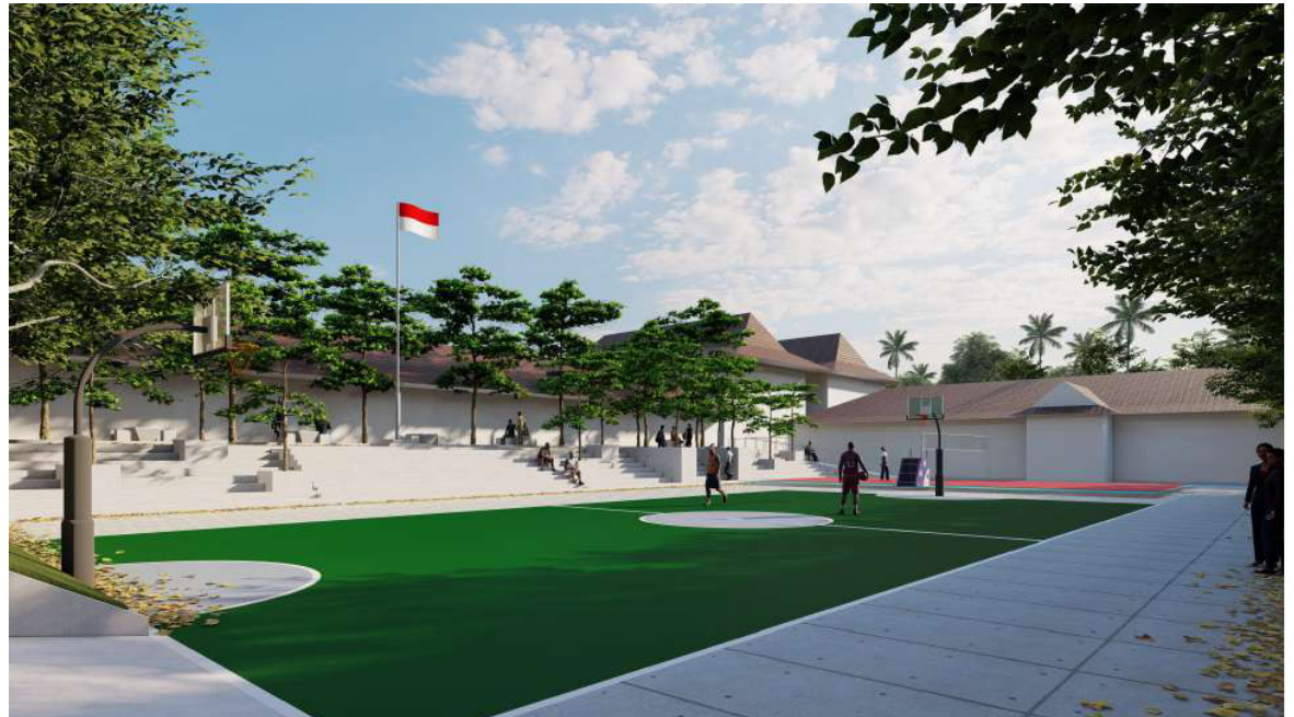
PENATAAN ULANG AREA LAPANGAN BASKET