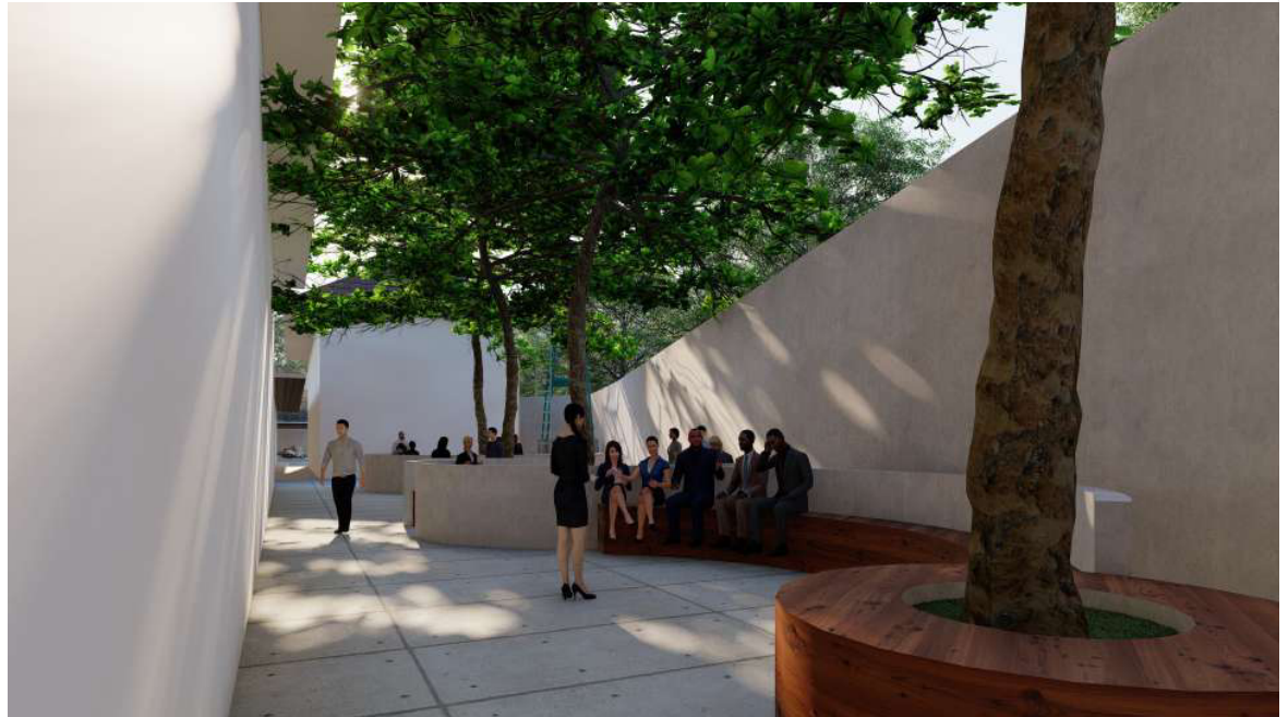
INJEKSI AKTIVITAS SEBAGAI TAMAN BACA