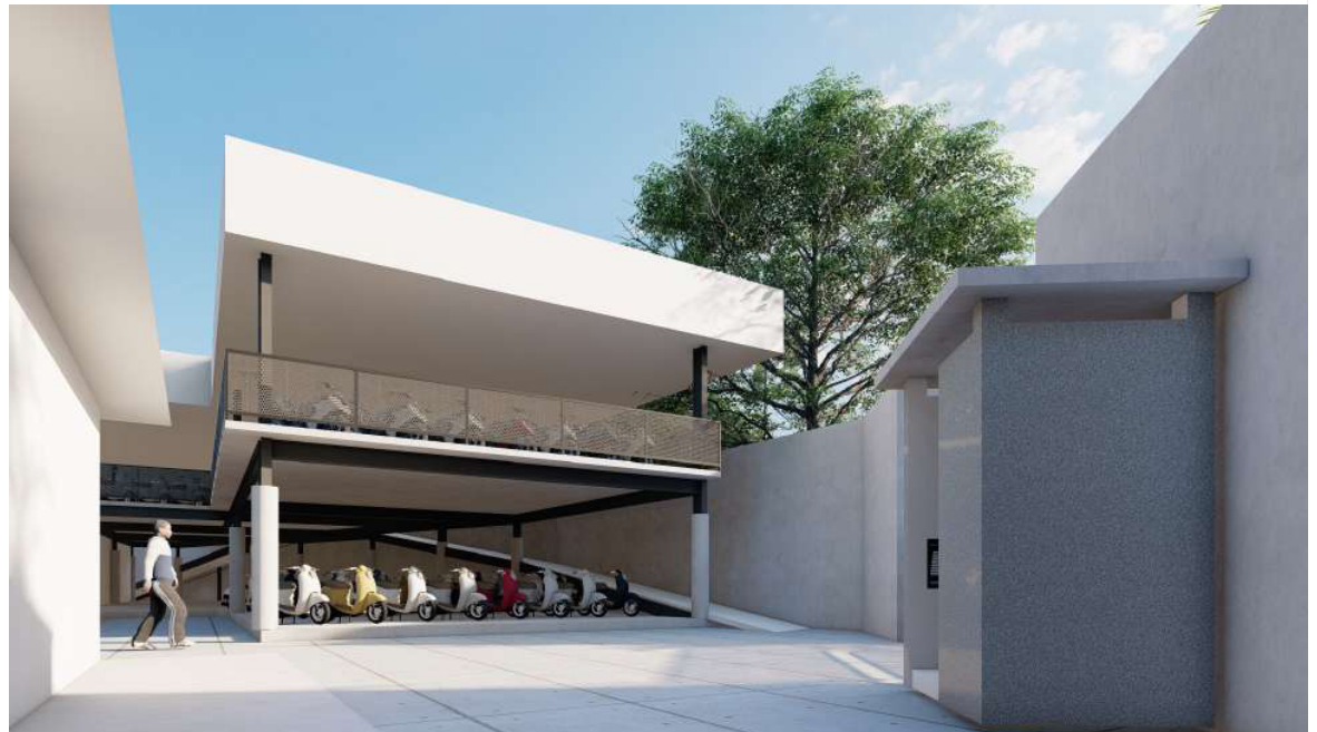
PENAMBAHAN PARKIRAN UNTUK SISWA/I