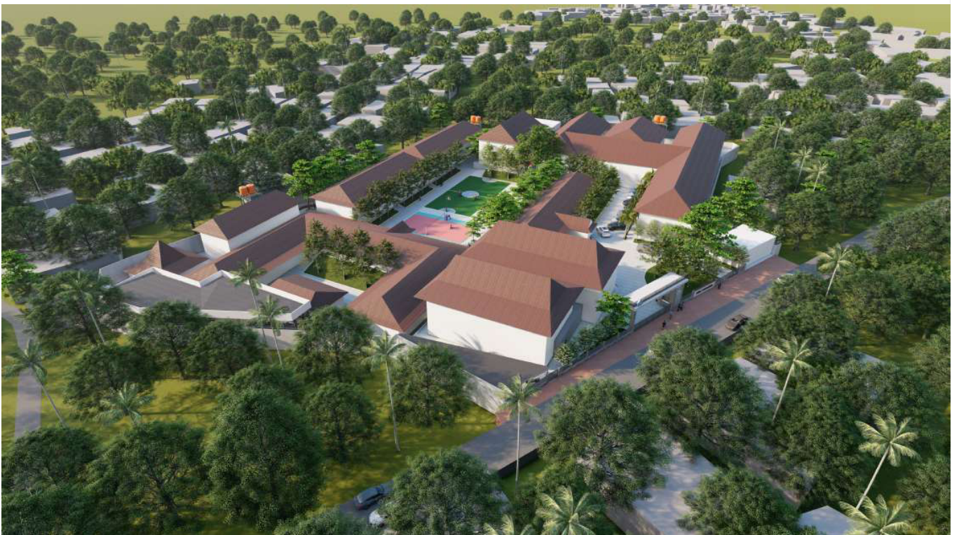
VISUALISASI AERIAL VIEW