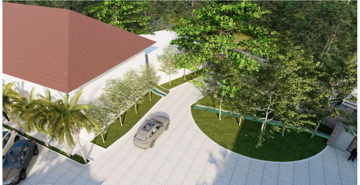
PENATAAN AREA SUNGAI