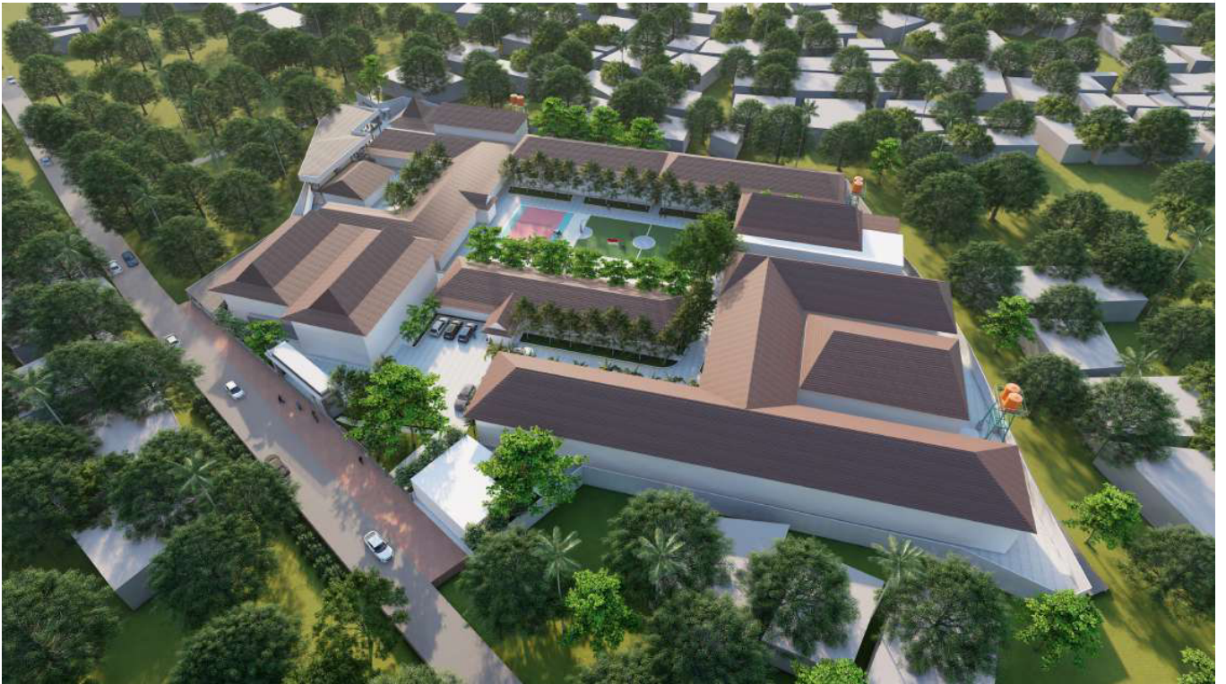
VISUALISASI AERIAL VIEW