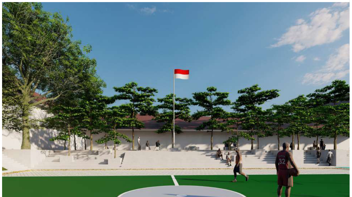
INJEKSI AKTIVITAS UNTUK AMPHITEATER DEKAT AREA LAPANGAN OLAAHRAGA