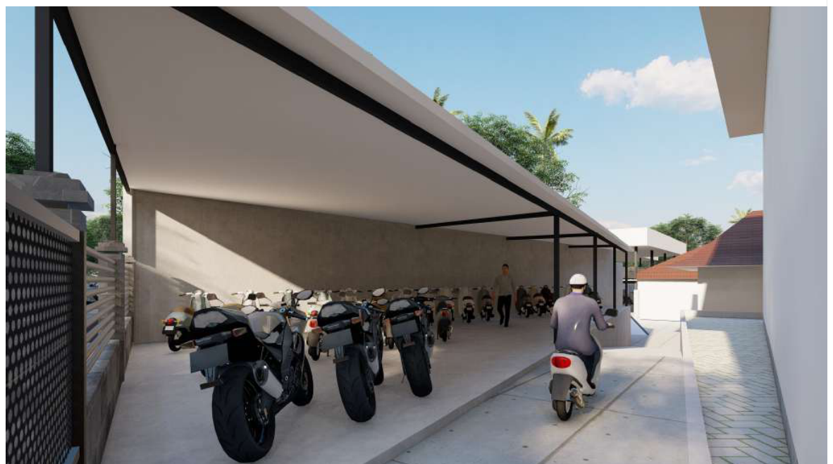
PENATAAN PARKIRAN UNTUK GURU & KARYAWAN