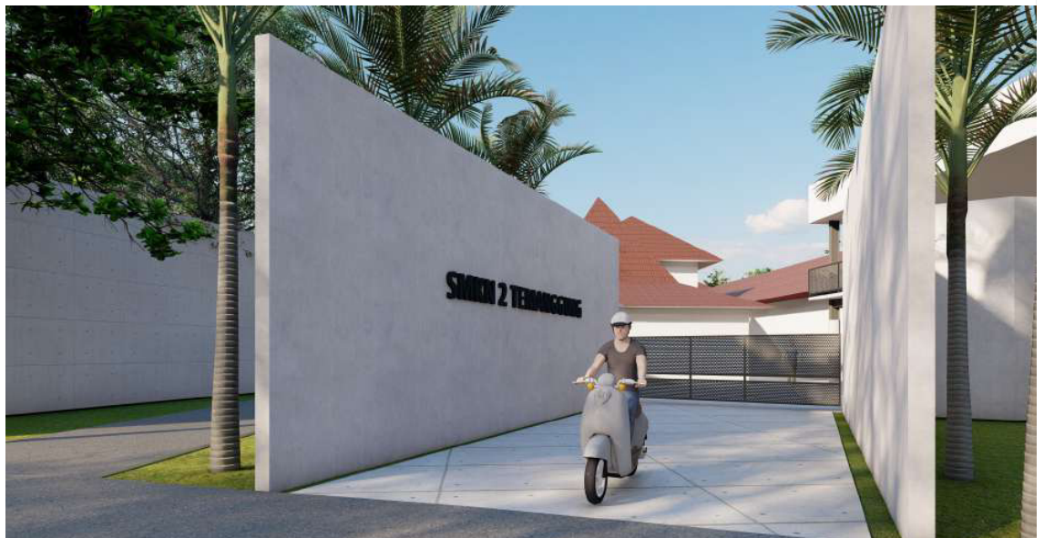
PENAMBAHAN GERBANG BELAKANG