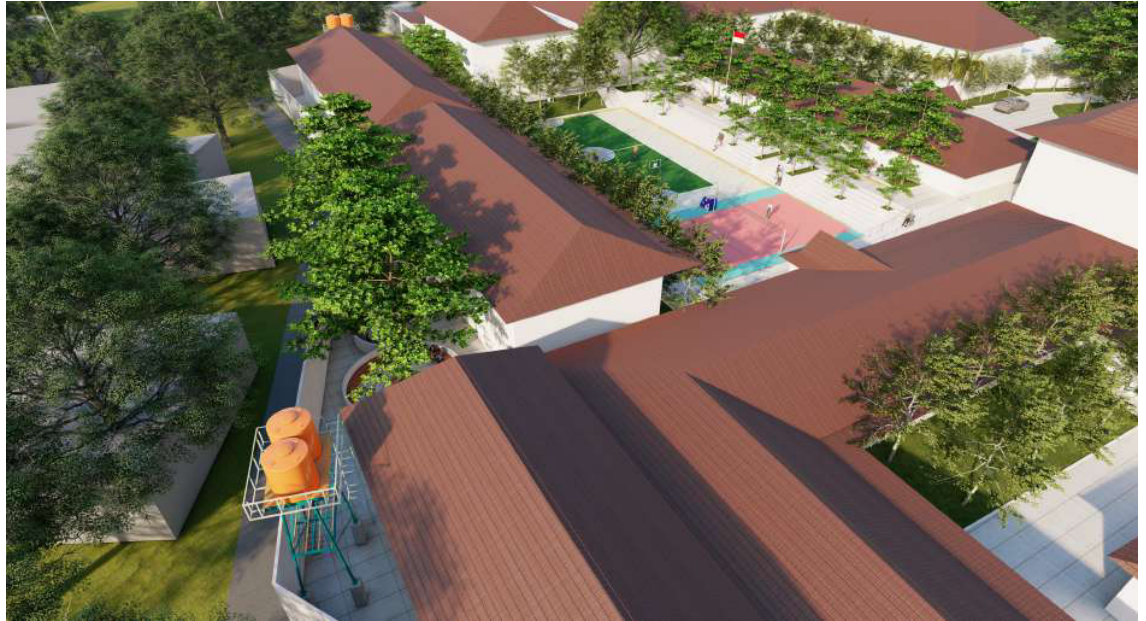
PENATAAN UNTUK PELETAKAN TANDON

PENATAAN UNTUK PELETAKAN UTILITAS AIR BERSIH (TANDOR AIR)