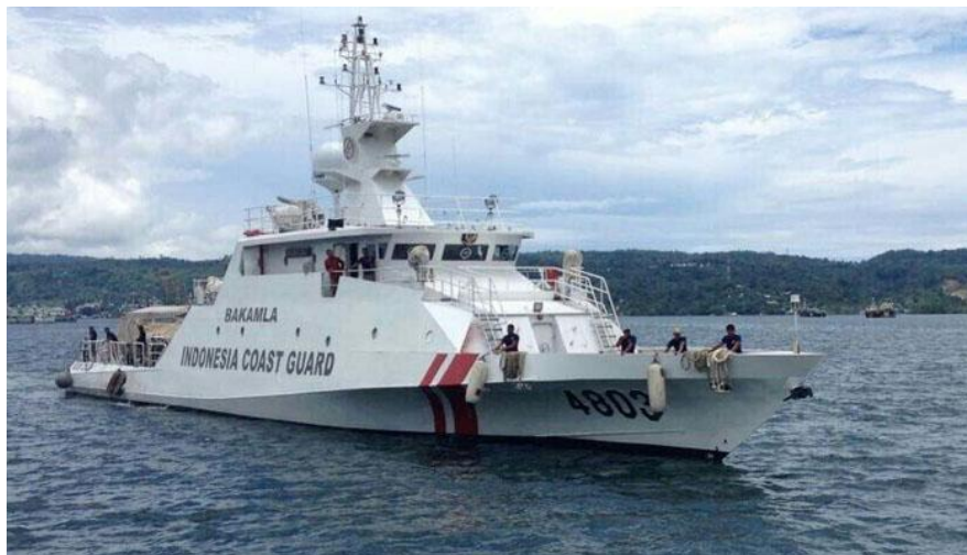
Table 1-Daftar Alutsista Kapal yang dimiliki Bakamla.