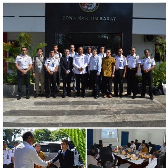
Gambar SEQ Gambar \* ARABIC 5- Kunjungan JCG dan JICA di Batam.

Pelatihan yang dilakukan antara Bakamla dengan JCG pun mencakup bidang Law Enforcement, Marine Environment Protection, On Board Exercise dan Maritime Law Enforcement . Pertukaran pengetahuan yang dilakukan oleh Bakamla dengan JCG diantaranya adalah kerja sama pendidikan formal Master For Maritime Security And Safety Program (MSSP), melakukan kegiatan ship visit dan combined exercise (TNI P. , 2019). Di pertengahan