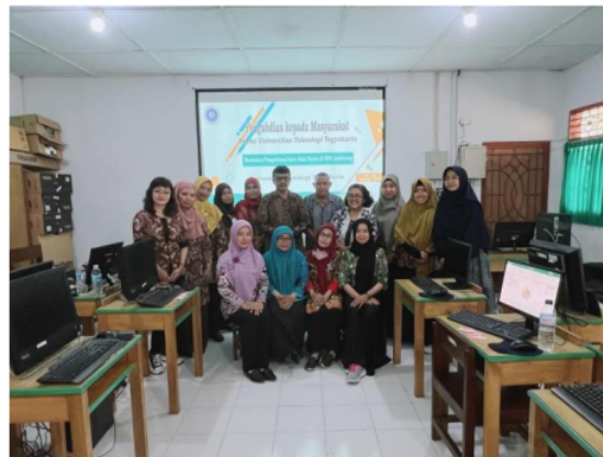
Gambar 6. Dokumentasi kegiatan pengabdian kepada masyarakat.

Dengan menggunakan Microsoft Excel, dapat dengan mudah dalam mengelola dan menganalisis data nilai siswa secara efisien.