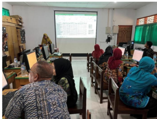
Gambar 1. Kegiatan pelatihan pengolahan data nilai siswa menggunakan Microsoft Excel .

Pada setiap akhir semester setiap guru mempunyai tugas dalam mengolah nilai akhir siswa. Pada pelatihan ini, para guru dapat memperoleh keterampilan baru dalam mengelola nilai akhir siswa. Gambar 1 memperlihatkan suasana kegiatan yang terjadi disaat pelaksanaan pelatihan Microsoft Excel .