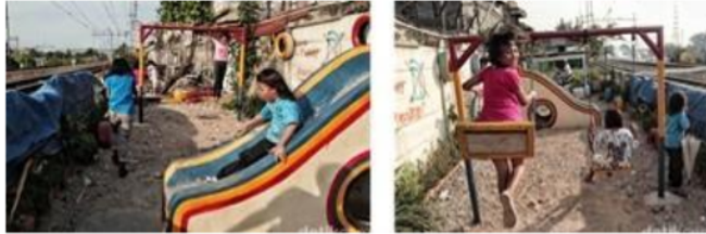
Gambar.2. Taman bermain anak di RUMIJA, Kampung Bahari, Jakarta

ada disitu bisa membahagiakan anak, menyalurkan keinginan bermain anak dan keluarga untuk berekreasi, maka akan digunakan, sehingga seringkali mengakibatkan kekacauan dan lack of architecture .