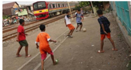
Gambar.3. Anak bermain di area sempadan jalur kereta api, Kemayoran, Jakarta

Gambar di atas memperlihatkan betapa anak-anak sangat membutuhkan ruang bermain, dan mereka terlihat cukup senang dengan yang ada, walaupun itu melanggar aturan dan berbahaya. Munculnya fenomena ini, merujuk pada perilaku kita yang dipengaruhi oleh kebutuhan psikologis yaitu (diantaranya) rasa ingin bersenang-senang, sehingga seringkali mengesampingkan kebutuhan fisik terkait keamanan dan kenyamanan. Dalam hal ini, kesenangan menempati posisi paling atas, hingga mampu mengesampingkan kebutuhan mendasar yang berkaitan dengan keamanan, kenyamanan, dan perlindungan, hingga pada akhirnya akan mempengaruhi bentuk ruang yang ada. Secara singkat menunjukkan bahwa suatu bentuk