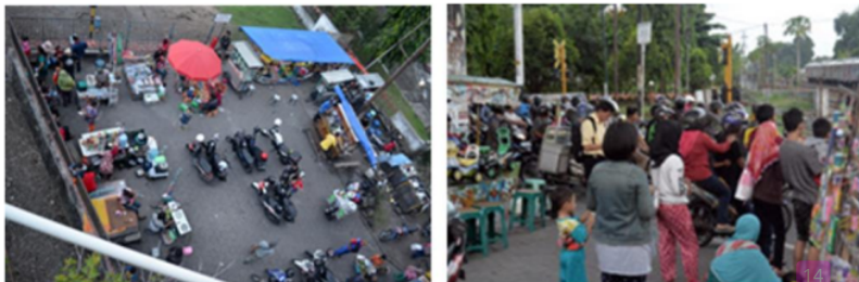
Gambar.1. Fenomena 'wisata dadakan' di Ruang Perbatasan Kereta Api “Ruang Milik Jalur Kereta Api” (RUMIJA) (Lokasi: underpass dan RUMIJA Lempuyangan, Kota Yogya).

Fenomena yang muncul saat ini adalah, justru di ruang-ruang yang seharusnya tidak boleh ada aktifitas masyarakat, akhirnya menjadi 'taman bermain' anak dan keluarga, menjadi tempat 'wisata dadakan', karena ketika orang mulai banyak memanfaatkan ruang-ruang 'terbuang' ini, akan ada hal lain yang mengikuti, yaitu munculnya PKL/pedagang asongan. Keberadaan PKL ini pada akhirnya turut membuat ruang-ruang tersebut semakin ramai dikunjungi orang, yang berdampak pada meningkatnya gesekan dengan pengguna jalan, serta semakin memperkecil tingkat keamanan dan keselamatan orang-orang yang berada di sana.