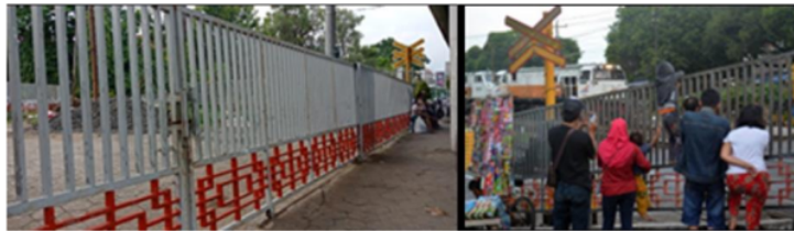
Gambar.4. Pagar sebagai ‘pemecah masalah’

Masalah mendasar dari teori ruang dalam istilah sosiologi adalah untuk menunjukkan bagaimana suatu individu menjadi kelompok, keluar sebagai perilaku dan pemikiran. Sosiologi mendefinisikan perilaku pada tingkat individu harus digambarkan dengan terminologi kelompok yang lebih luas (Hiller dan Hanson, 1984: 201). Hal ini memberikan pemahaman bahwa terbentuknya ruang dan seperti apa ruang tersebut berwujud, sangat dipengaruhi oleh perilaku masyarakat, terutama masyarakat setempat, sehingga sudah selayaknya pendekatan psikologi lingkungan diterapkan dalam merancang ruang yang lebih humanis.