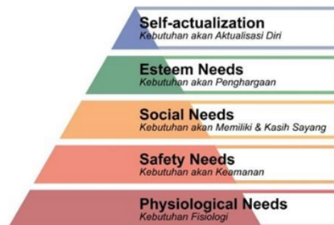
Gambar.5. “The Pyramid of Human Needs” Abraham Maslow

mengatakan, “Kemiskinan bahasa rupa , keterbatasan pemahaman sumber inspirasi dari warisan arsitektur yang ada, kepekaan terhadap suara dan jeritan orang serta krisis komunikasi, adalah masalah yang perlu disikapi bersama, guna mendapatkan konteks perspektif baru tentang arsitektur sebagai bagian intrinsik dari kehidupan sehari-hari dan kehidupan manusia yang berbudaya. Arsitektur tidak boleh dilihat hanya sebagai produk dengan penekanan pada gaya yang 'fotogenik', melainkan sebagai proses yang mengandung makna mendalam dengan partisipasi aktif dari semua pengguna. Dalam proses ini akan menjadi mungkin untuk menciptakan lingkungan yang terkesan 'tidak teratur', tidak sesuai dengan gambaran ideal yang telah ditetapkan sebelumnya. Namun jika 'ketidakteraturan' tersebut ternyata serasi dengan kehidupan manusia, kita tidak perlu khawatir “ Chaos is another form of order ” (Jones 1984:6)”. Dengan kata lain, penataan ruang publik harus memperhatikan faktor humanisme. Humanisme sendiri merupakan konsep yang menjadikan manusia dan lingkungan sebagai tolok ukur utama. Humanisme menekankan manusia itu sendiri, aktualisasi diri, kesehatan, harapan, kasih sayang, kreativitas dan makna menjadi individu yang bermakna. (Abraham Maslow).