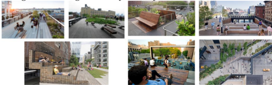
Gambar.6. Desain yang humanis di ruang bekas jalur rel kereta api. Lokasi: High Line Park, Manhattan, New York

Dengan pendekatan psikologi lingkungan, penataan ruang terbuka publik menjadi media aktualisasi dalam lingkup masyarakat, dimana ketika mencapai puncak tertinggi piramida Maslow akan tercipta masyarakat (mulai dari level anak-anak hingga orang tua) yang sehat jasmani dan rohani, sehingga pembangunan masyarakat secara utuh akan tercapai. Alih-alih memasang pagar seperti pada gambar.4. di atas, desain yang mempertimbangkan humanisme dapat menjadi solusi dalam 'mengatur' sekaligus membahagiakan masyarakatnya.