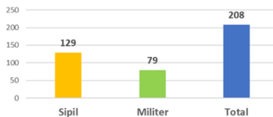
Gambar 1. Pilihan Berdasar Latar Belakang Capres

Pada Gambar 1, dapat dilihat kecenderungan pemilih memilih sipil sebagai calon pemimpinnya. Dari 208 responden, sebanyak 129 responden