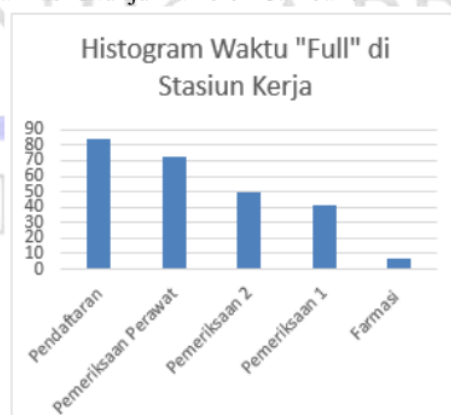
Gambar 4. Waktu Proses yang memiliki Persentase Full terbesar

Berdasarkan hasil pengukuran menggunakan peta kendali p menunjukkan bahwa pada bagian pemeriksaan 1 terdapat data yang berada di luar batas kendali/control sehingga bagian tersebut perlu dilakukan perbaikan sistem. Sedangkan berdasarkan hasil simulasi dari kondisi existing system didapatkan beberapa hal yang perlu diperbaiki, yaitu Bagian Pendaftaran, Bagian Pemeriksaan Perawat, Pemeriksaan 2, Pemeriksaan 1, dan Farmasi ditunjukkan oleh Gambar 5.